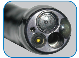
Bout de l'endoscope avec: