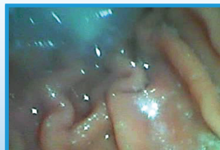
L'estomac d'un chat de 3.5kg