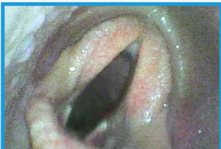
Voies respiratoires du cheval