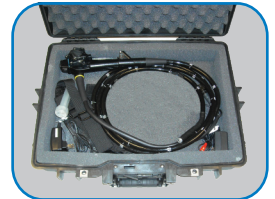
Coffre de transport solide