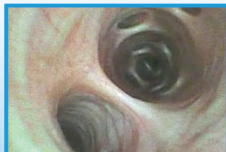
Voies respiratoires du cheval