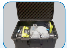
Pompe d'aspiration eau/air (optionnel)