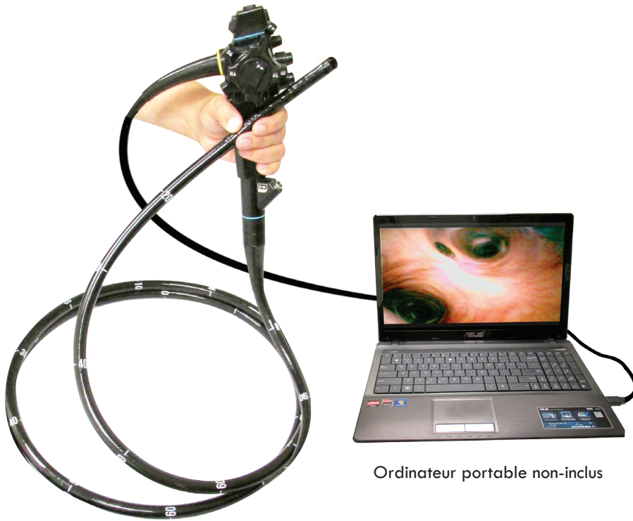
Ordinateur portable non-inclus