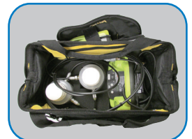
Pompe air/eau dan Coffre de transport (optionnel)